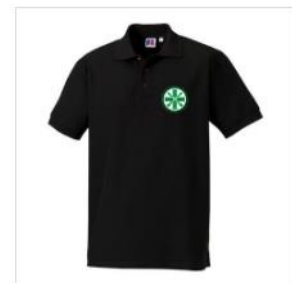
Poloshirt Herren €25.00