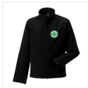
Softshelljacke Herren €62.00

Die Polos gibt es in Schwarz und Weiß, die Jacken nur in schwarz. Unser Logo wird wie in der Vergangenheit in grün-weiß gehalten sein, allerdings nicht mehr ganz so dominant groß erscheinen.