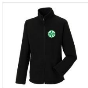
Fleecejacke Herren €33.00