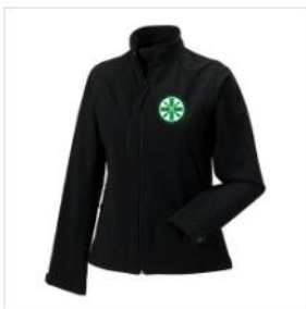
Softshelljacke Damen €62.00