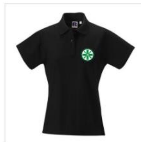
Poloshirt Damen €25.00